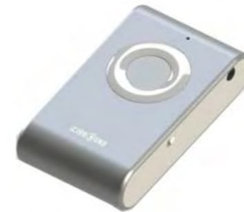
圖 1. 產品示意圖 (1)

本計畫之產品 NXpace，透過藍芽功能，無線遠端遙控裝置，結合手機拍照存儲、擴充記憶體等等現代人最常用的手機功能，技術皆為軟硬體工程師自行研發，在研發過程當中，透過與客戶、經銷商不斷的溝通，並進行市場分析，使用者經驗調查，來調整 NXpace 藍芽隨身裝置的功能與外型。從原本的汽車鑰匙外型更改為簡約 Apple style 的外型，無論是整體外觀、按鍵設計、側邊孔位等等都經過多方設計，期能更貼合消費大眾的喜好。NXpace 的內部機構與重量，在硬體工程師的不斷努力下，也窩小了內部機板的 size 與重量，期望能更加輕巧；另外更注意到電池待機時間的問題，原本 wifi 模組相當耗電，經過不斷的討論與測試，終於研發出利用藍芽低功耗的特性，將 NXpace 的待機時間從原本的 2~3 小時，延長至 1 個月，透過休眠與喚醒的模式，讓使用者能夠輕鬆將 NXpace 隨身攜帶，成為一個時尚的隨身串流裝置。