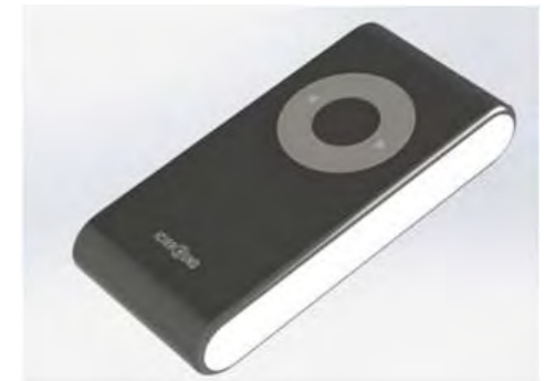
圖 2. 產品示意圖 (2)